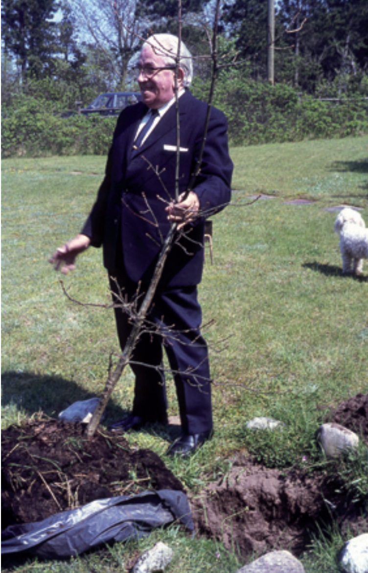
Martinus är här fotograferad med trädet, klart för plantering.

Men innan dess planterades ännu en minnesek på Fyrrebakken, Klintvej 57, snett emot Villa Rosenberg, den 11 maj 1972.