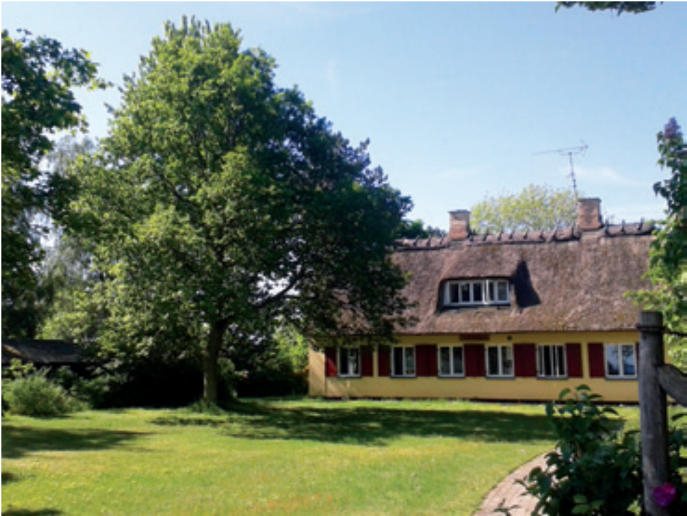
Och här ser vi trädet i dag.