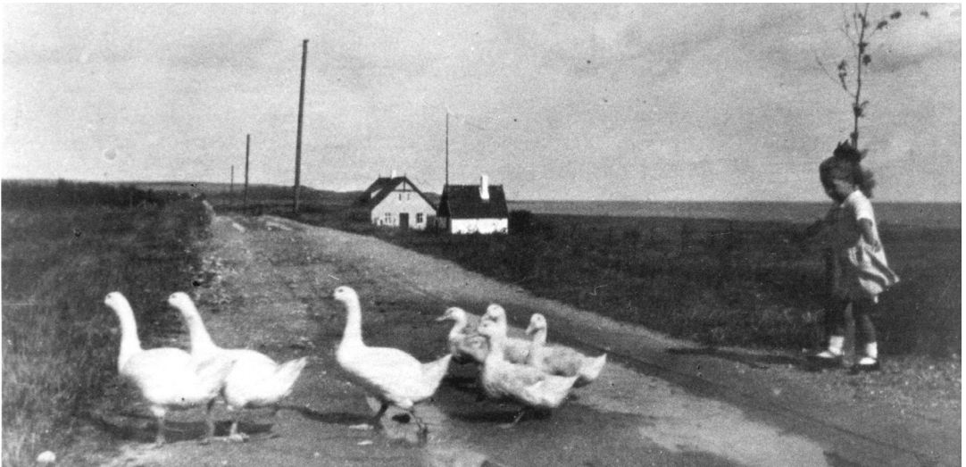
Villa Rosenberg (som på den tiden hette Rødhætte, som i svensk översättning blir Röd-luvan), havet och Klintebjerg i bakgrunden – innan Martinus Center fanns.

Det är fråga om ett mycket omfattande och tidskrävande arbete med inskanning och insamling av upplysningar och vi förväntar oss att projektet löper över flera år.